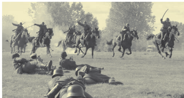
Rekonstrukcja bitwy nad Bzurą Sochaczew 2005